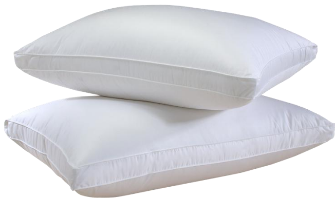
Подушки для сна